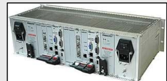
Figure 2 : ALSPA MFC3000 - Contrôleur multifonction basé sur le standard industriel

La seconde innovation est l'introduction de contrôleurs multifonctions sur la base du standard industriel cPCI, à hautes performances de calcul, et bien entendu, sécurisés (redondance avec « hot standby », OS temps réel sécurisé)